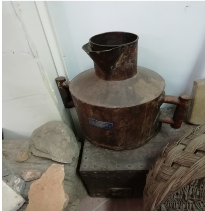
basto Foto n° 3