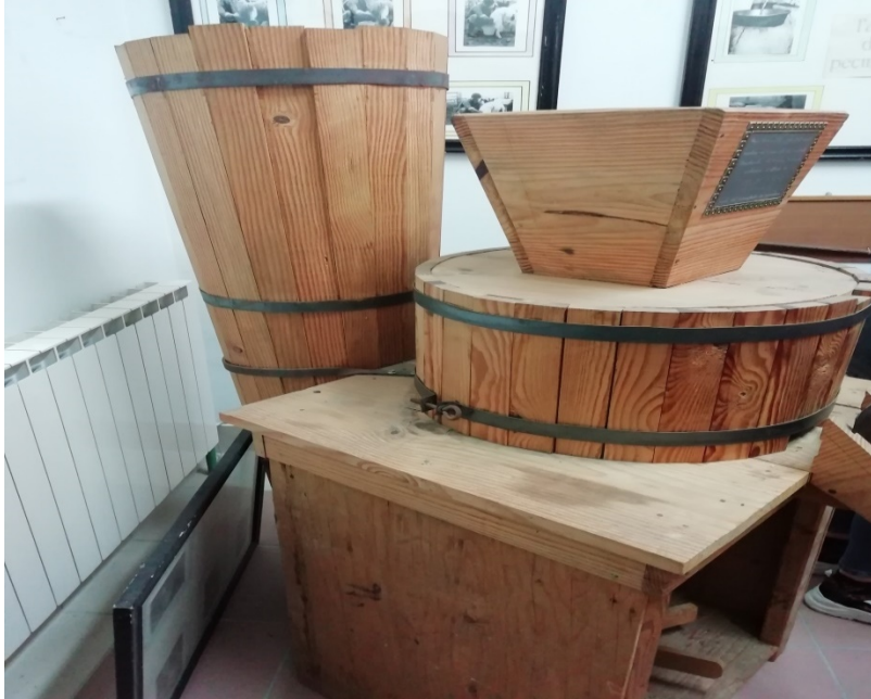
Bumbula e terracotta (per abbombare la volta) Foto n° 9